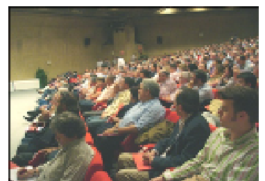
Vista parcial de la sala de la I Convención de Técnicos y Cuadros de UGT

Desde la ATC (Agrupación de Técnicos y Cuadros) de la FeS , nos ponemos manos a la obra.